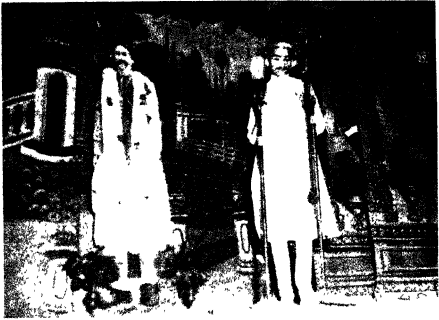
कांग्री-नरेश श्रीमान् विभूतिनारायण सिंह द्वारा भारतेन्दु शती उत्सव का उद्घाटन